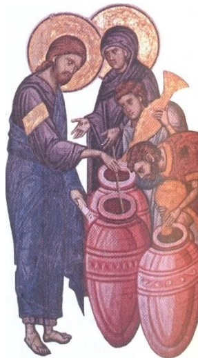
Ћупови за уље и вино, деталј фреске из манастира Дечана

ђерђеф - оквир у који се ставља платно по којем се везе